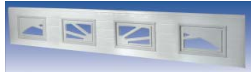
Fenêtres à encastrer, type "lever du soleil"

Votre porte de garage détermine en grande partie l'aspect de votre habitation. Lors de l'achat d'une porte de garage, la forme est donc très importante. Avec Solid-S500, vous avez le choix entre trois modèles, avec lesquels vous pouvez donner à votre porte une note personnelle.