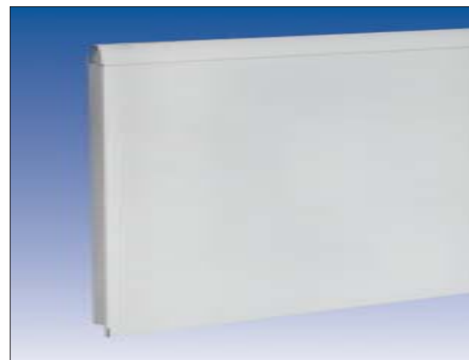
Les panneaux de portes sont réalisés avec un profil anti-coincement, pour éviter que les doigts ne se coincent.