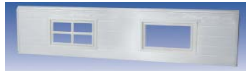
Fenêtres à encastrer, "croix" & "fenêtre rectangulaire"